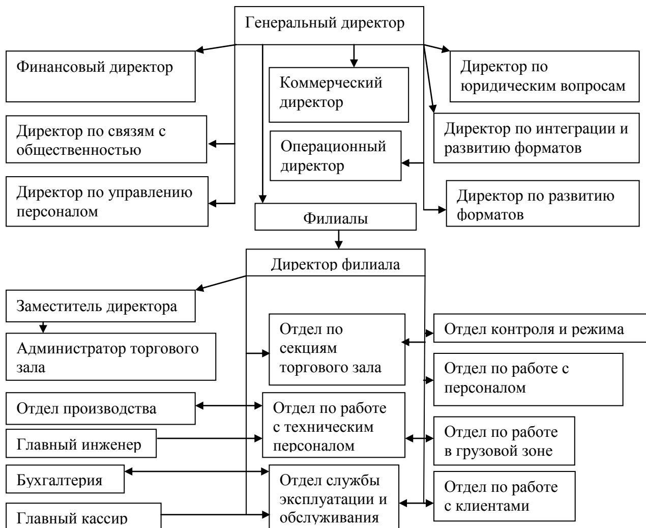
Рис.1. Организационная структура ООО «Лента»

На рисунке 1 представлена организационная структура компании ООО «Лента»