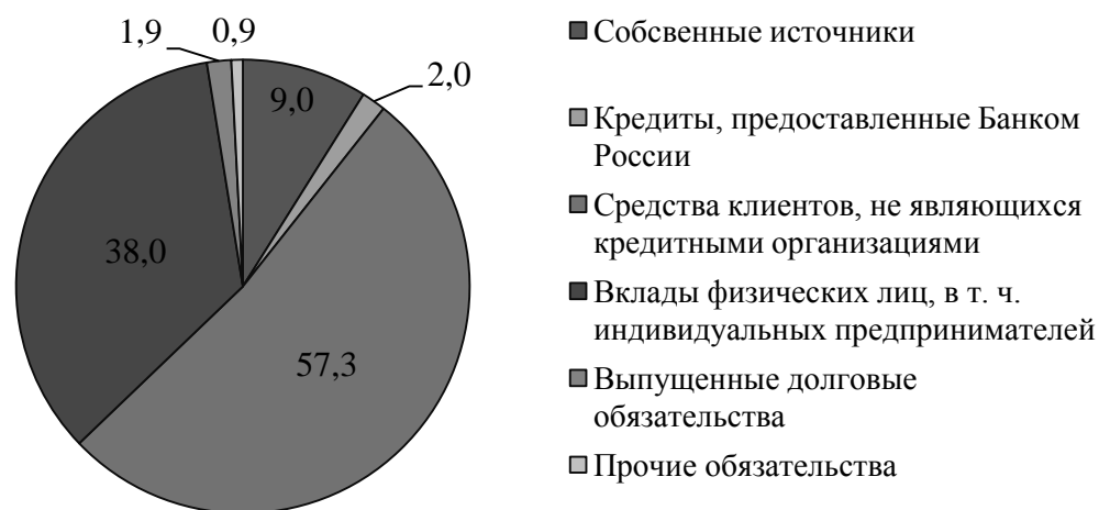
Рис. 1. Структура ресурсов ПАО «Сбербанк России» в 2017 г., %

Структуру ресурсов банка с делением на привлеченные ресурсы изображена на рисунке 1.