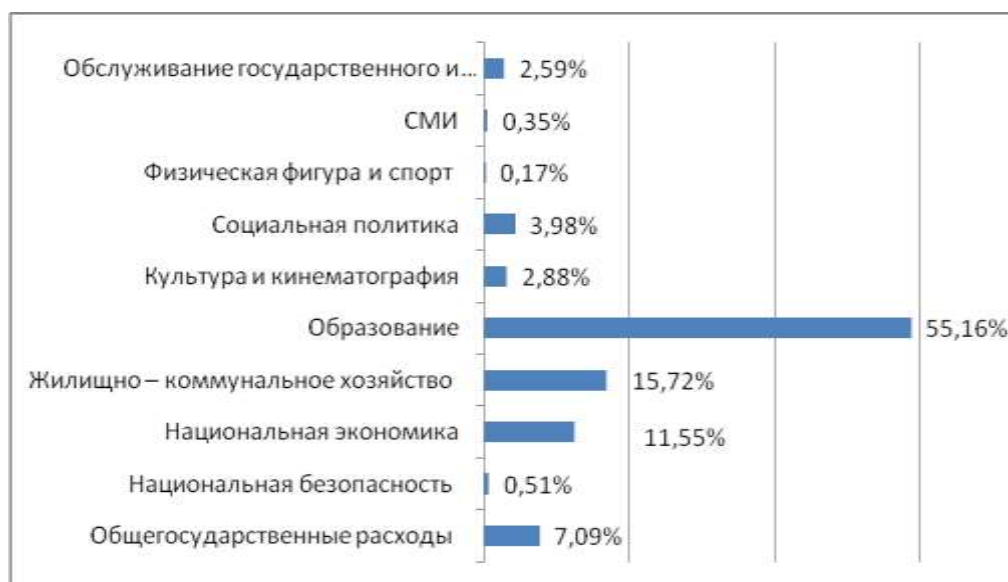
Рисунок 1 – исполнение бюджета города Смоленска по расходам за 2014 год.

В соответствии с данными таблицы были построены диаграммы по каждому году.