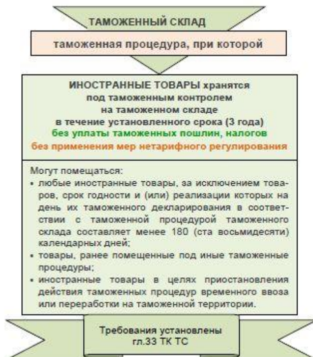
Рис. 1. Условия помещения товаров под таможенную процедуру таможенного склада

Содержание таможенной процедуры таможенного склада, условия помещения товаров под таможенную процедуру и сроки хранения товаров на таможенном складе определены статьями 229 - 231 Таможенного кодекса Таможенного союза (рис. 1).