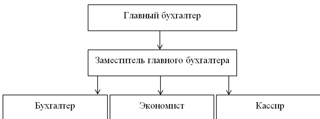
Рис. 2. Структура бухгалтерского аппарата СОГАУ ДПО «Учебный центр»

Кроме того, бухгалтерия предприятия должна обеспечивать обработку документов, рациональное ведение записей в учетных регистрах, своевременное представление руководству информации об обороте и валовом доходе, о состоянии товарных запасов и эффективности их использования, составление отчетности. Структура бухгалтерского аппарата СОГАУ ДПО «Учебный центр» представлена на рисунке 2.